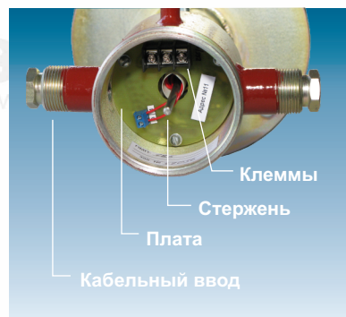
Рис. 2. Устройство корпуса